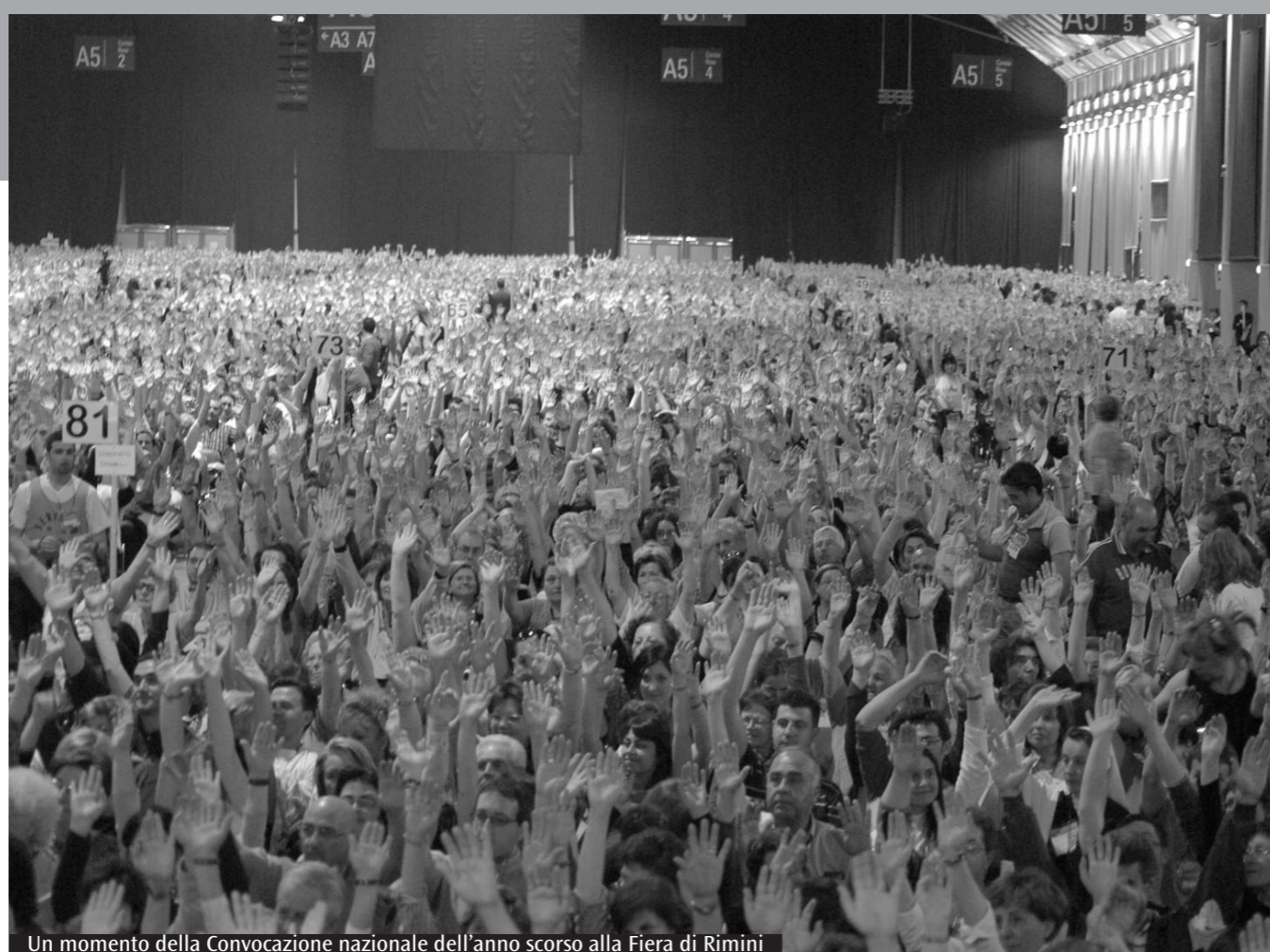
Un momento della Convocazione nazionale dell'anno scorso alla Fiera di Rimini

8.30: preghiera comunitaria carismatica. Comunicazioni sulla vita del Movimento, interviene Marcella Reni, direttore RnS. Relazione conclusiva sul tema del convegno di Salvatore Martinez, presidente nazionale RnS. Concelebrazione eucaristica, presieduta da Giovanni Battista Re, prefetto della Congregazione per i Vescovi. 13.15: fine sessione e congedo.