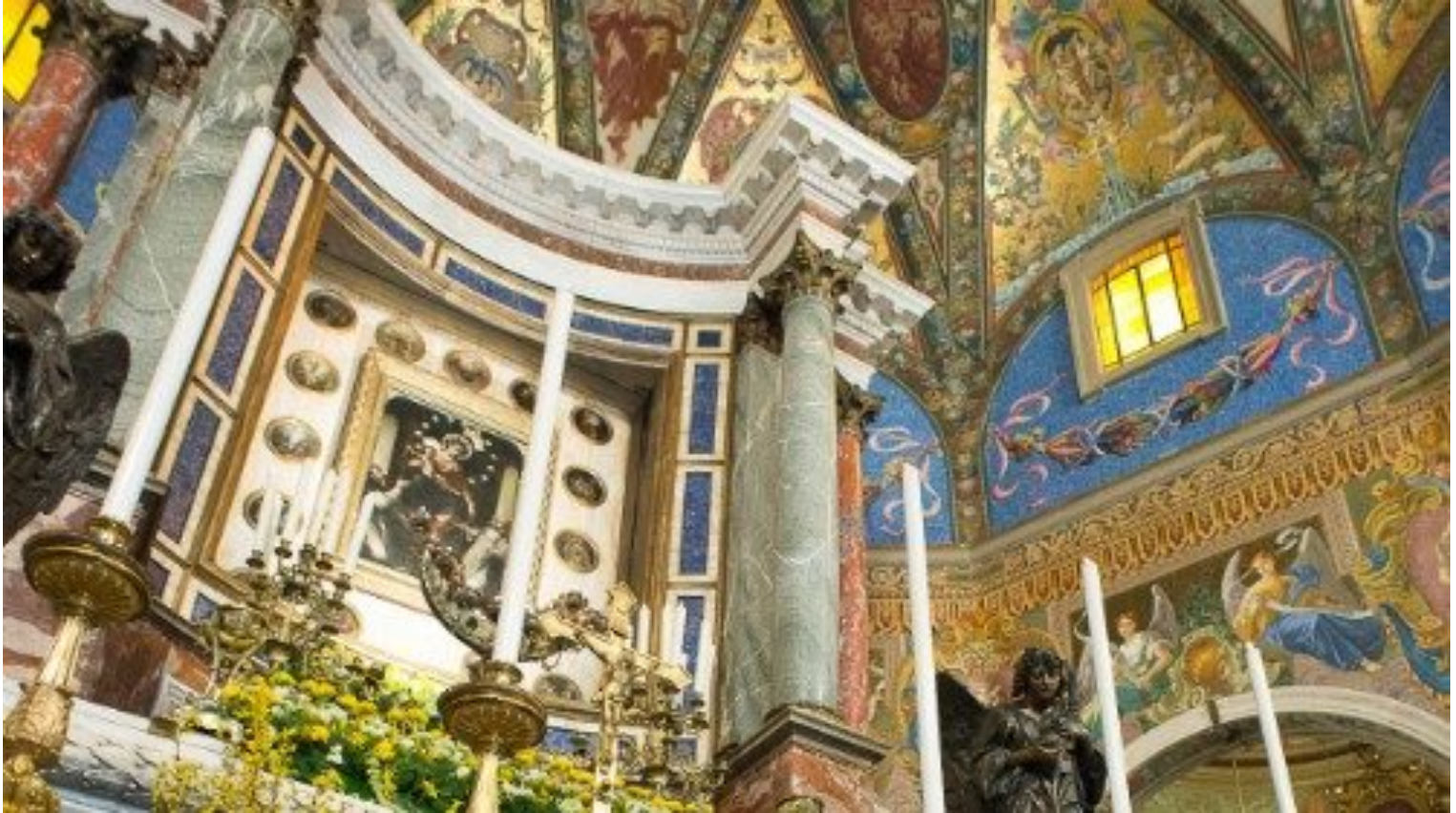
Santuario di Pompei