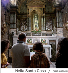
Nella Santa Casa / Silvio Ferrarini

I santuari mariani di Loreto e Pompei con gli arcivescovi Dal Cin e Caputo al centro del pellegrinaggio delle famiglie organizzato dal Rinnovamento nello Spirito Santo. «Genitori e sposi eroi del nostro tempo»