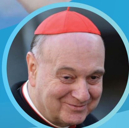
Sua Em.za Rev.ma Card. Angelo Comastri Arciprete Basilica papale di San Pietro in Vaticano. Presidente della Fabbrica di San Pietro. Vicario generale di Sua Santità per la città del Vaticano.