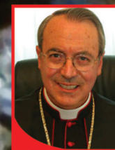
S.E. Mons. Francesco Lambiasi Vescovo di Rimini